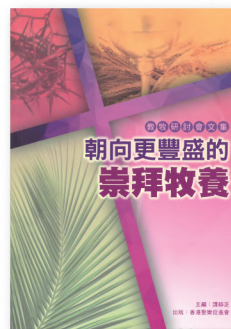
教牧研討會文集 I PCS001 《朝向更豐盛的崇拜牧養》