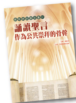
教牧研討會文集 IV PCS004 《誦讀聖言作為公共崇拜的骨幹》