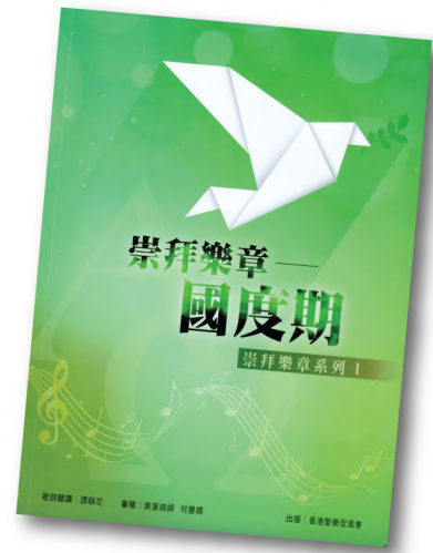
崇拜樂章系列 I SML001 《國度期》