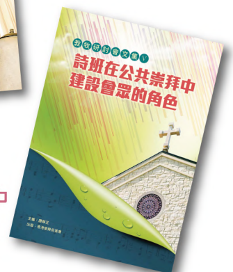
教牧研討會文集 V PCS005 《詩班在公共崇拜中建設會眾的角色》