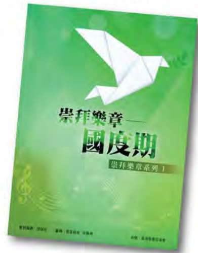
崇拜樂章系列 I SML001 《國度期》