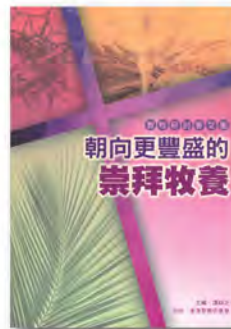
教牧研討會文集 I PCS001 《朝向更豐盛的崇拜牧養》