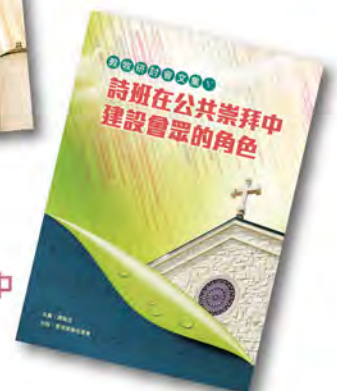
教牧研討會文集 V PCS005 《詩班在公共崇拜中建設會眾的角色》