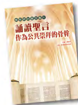
教牧研討會文集 IV PCS004 《誦讀聖言作為公共崇拜的骨幹》