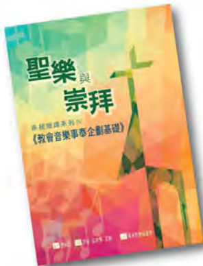
聖樂與崇拜系統開課系列 IV CM004 《教會音樂事奉企劃基礎》