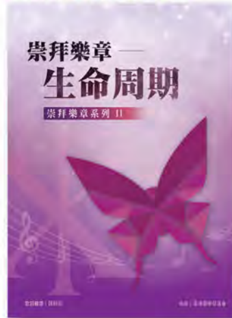
崇拜樂章系列 II SML002 《生命周期》