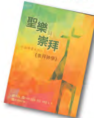
聖樂與崇拜系統開課系列 II CM002 《崇拜神學》