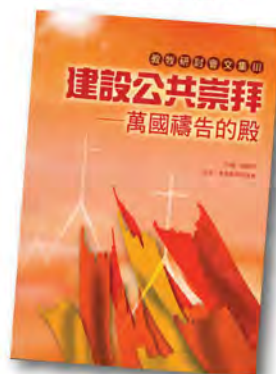
教牧研討會文集 III PCS003 《建設公共崇拜——萬國禱告的殿》