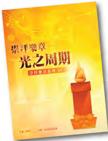
崇拜樂章系列 III SML003 《光之周期》