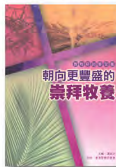
教牧研討會文集 I PCS001 《朝向更豐盛的崇拜牧養》